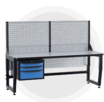
SPC A18.3-1R Антистатический стол SPC 18.3-1R Монтажный стол