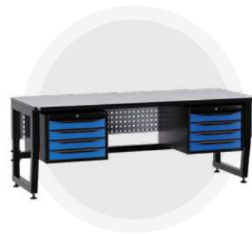
SPC A18.44 Антистатический стол SPC 18.44 Монтажный стол