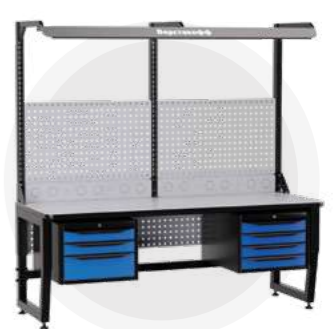
SPC A18.34-1FR Антистатический стол SPC 18.34-1FR Монтажный стол