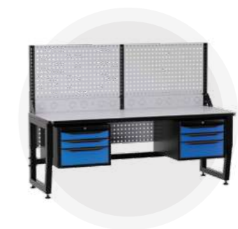
SPC A18.33-1R Антистатический стол SPC 18.33-1R Монтажный стол