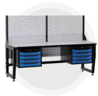
SPC A18.44-1R Антистатический стол SPC 18.44-1R Монтажный стол