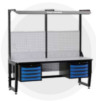
SPC A18.44-1FR Антистатический стол SPC 18.44-1FR Монтажный стол