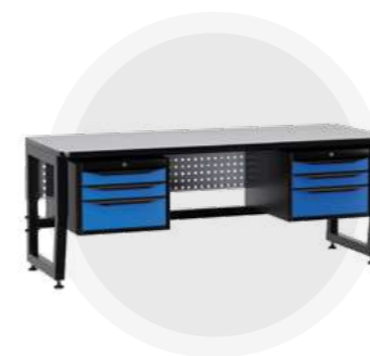
SPC A18.33 Антистатический стол SPC 18.33 Монтажный стол