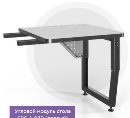
Угловой модуль стола SPC A 07R (правый) Угловой модуль стола SPC 07R (правый)