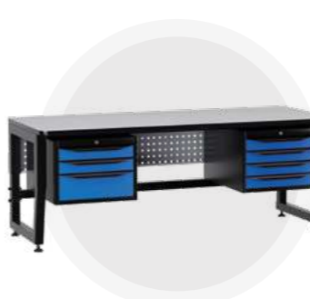
SPC A18.34 Антистатический стол SPC 18.34 Монтажный стол