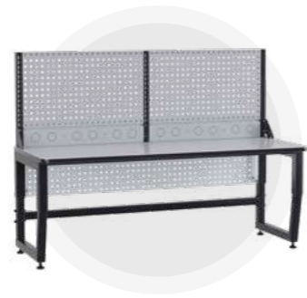
SPC A18.0-1R Антистатический стол SPC 18.0-1R Монтажный стол