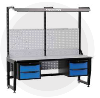
SPC A18.22-1FR Антистатический стол SPC 18.22-1FR Монтажный стол