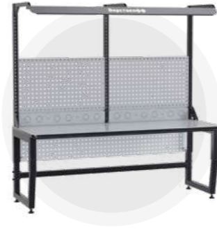
SPC A18.0-1FR Антистатический стол SPC 18.0-1FR Монтажный стол