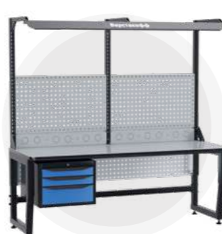
SPC A18.3-1FR Антистатический стол SPC 18.3-1FR Монтажный стол