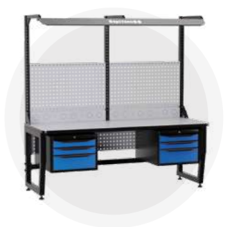
SPC A18.33-1FR Антистатический стол SPC 18.33-1FR Монтажный стол