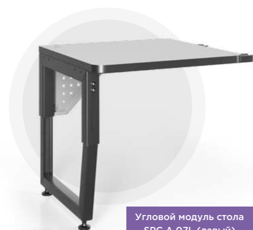
Угловой модуль стола SPC A 07L (левый) Угловой модуль стола SPC 07L (левый)

Угловой модуль антистатического стола - позволяет эффективно использовать угловую область помещения, которая обычно остается неиспользованной. Это особенно полезно в небольших помещениях, где каждый квадратный метр имеет значение. Угловой модуль является практичным и удобным решением для организации рабочего пространства, обеспечивает комфорт, эргономику и функциональность.