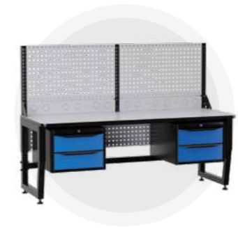
SPC A18.22-1R Антистатический стол SPC 18.22-1R Монтажный стол