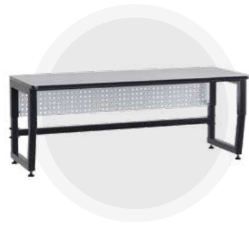
SPC A18.0 Антистатический стол SPC 18.0 Монтажный стол