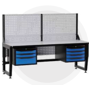
SPC A18.34-1R Антистатический стол SPC 18.34-1R Монтажный стол