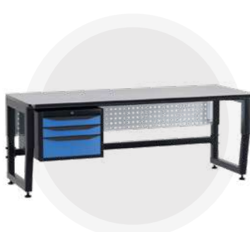
SPC A18.3 Антистатический стол SPC 18.3 Монтажный стол