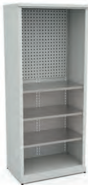
Шкаф для инструментов ERGO XM 03