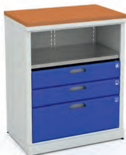
Шкаф для инструментов ERGO 1/2 XM 03