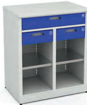
Шкаф для инструментов ERGO 1/2 XM 08