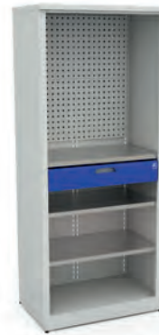
Шкаф для инструментов ERGO XM 04