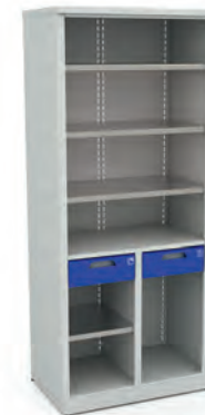
Шкаф для инструментов ERGO XM 10