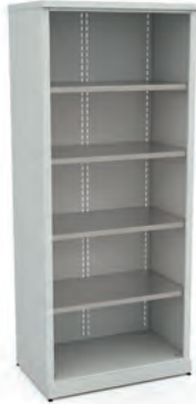
Шкаф для инструментов ERGO XM 01