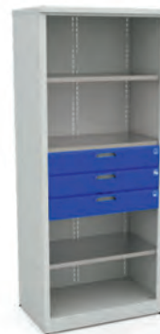
Шкаф для инструментов ERGO XM 06