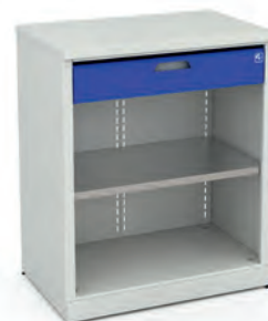
Шкаф для инструментов ERGO 1/2 XM 02