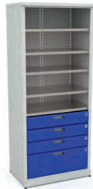
Шкаф для инструментов ERGO XM 08