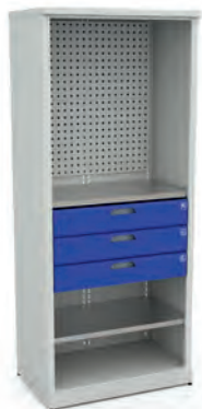
Шкаф для инструментов ERGO XM 07