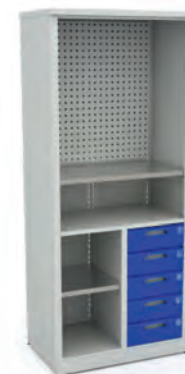
Шкаф для инструментов ERGO XM 12