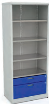
Шкаф для инструментов ERGO XM 05