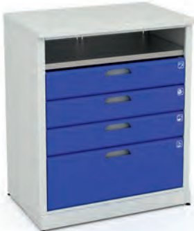
Шкаф для инструментов ERGO 1/2 XM 09