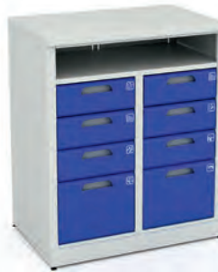
Шкаф для инструментов 1/2 XM 06