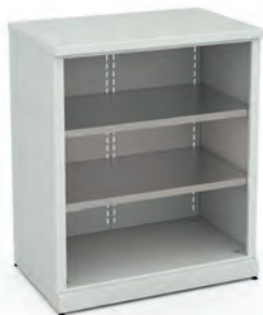
Шкаф для инструментов ERGO 1/2 XM 01

Все представленные модели шкафов в базовой комплектации имеют двери указанного типа.