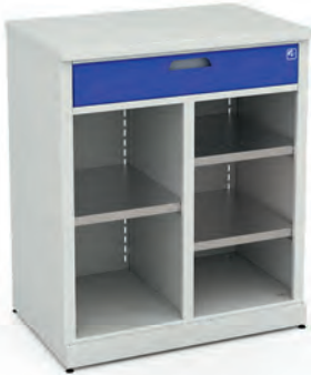
Шкаф для инструментов ERGO 1/2 XM 07

Все представленные модели шкафов в базовой комплектации имеют двери указанного типа.