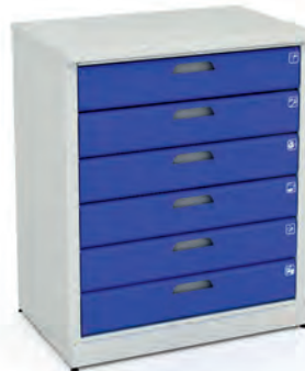
Шкаф для инструментов ERGO 1/2 XM 10