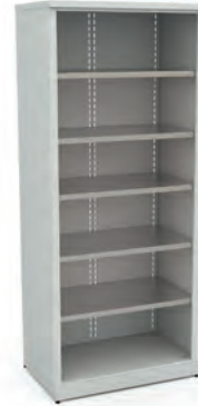
Шкаф для инструментов ERGO XM 02