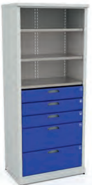
Шкаф для инструментов ERGO XM 09