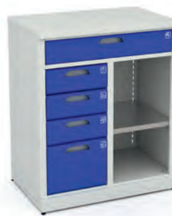
Шкаф для инструментов ERGO 1/2 XM 04