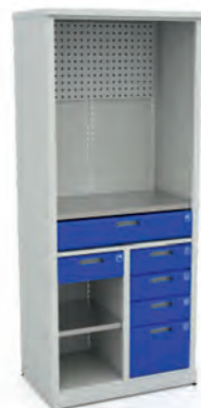
Шкаф для инструментов ERGO XM 11