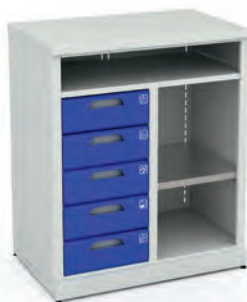
Шкаф для инструментов ERGO 1/2 XM 05